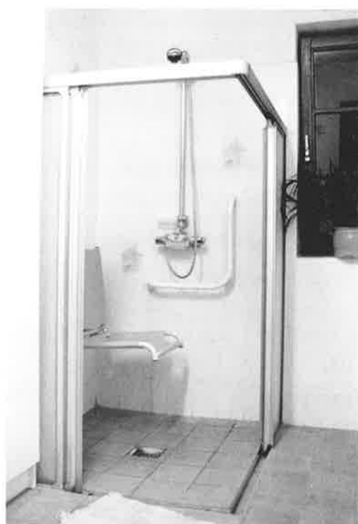
Exemple de douche adaptée.

C'est ainsi que 58 personnes occupent déjà un logement de plain-pied et 22 personnes utilisent ascenseur, monte-charge ou mono-lift. Certaines d'entre-elles bénéficient: d'un ouvre porte électrique ou de portes suffisamment larges pour la voiturette ou de douche ou de cuisine adaptées.