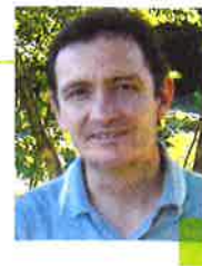
Réalisé par les : D r Nathalie CHARBONNIER Journaliste