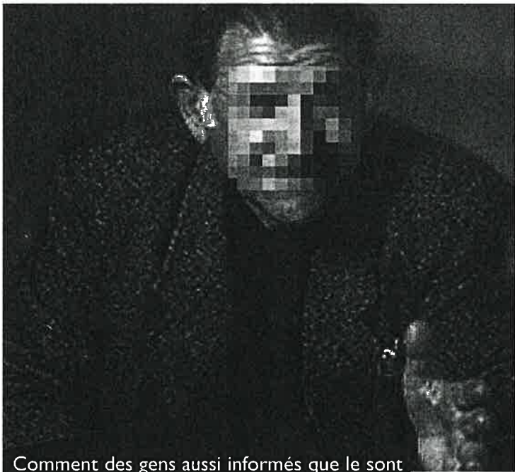
Comment des gens aussi informés que le sont les patients d'aujourd'hui peuvent-ils se laisser prendre aux mensonges de ces charlatans ?

Notre époque, qui a vu naître les résultats les plus spectaculaires de la médecine, est aussi le siècle privilégié des charlatans. Tout le monde sait que la sclérose en plaques est encore, à l'heure actuelle, une maladie incurable. Pourtant, que de remèdes miracles proposés aux infortunés patients ! Cette année 1999, est celle de l'information. Tout le monde est soi-disant « informé ». Toutefois, les charlatans fleurissent. Chacun tend à expliquer que son système va apporter, sinon une guérison rapide, du moins un soulagement effectif. Tel charlatan va fonder une religion basée sur les plantes médicinales. Tel autre va remplir son temple avec la pro-