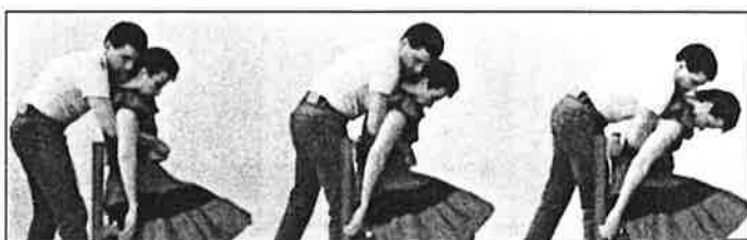
Manœuvre effectuée sur une personne assise.