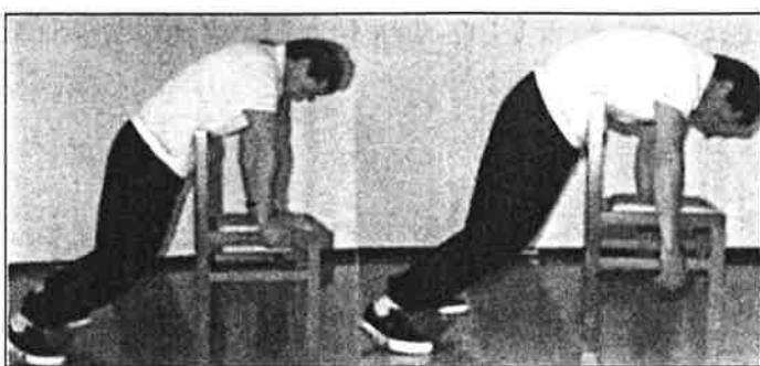
Manœuvre autonome effectuée sur le dos d'une chaise.