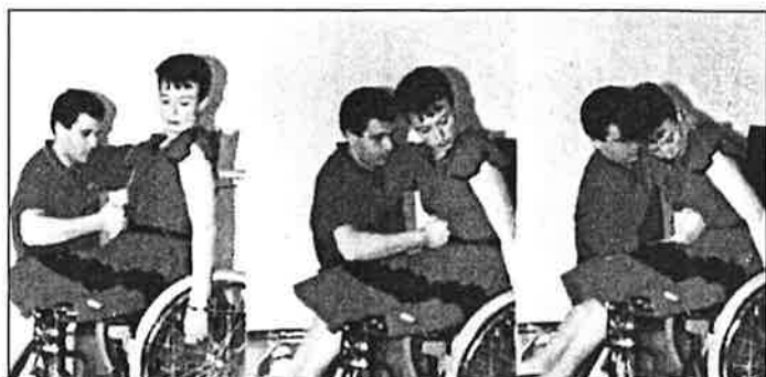
Manœuvre effectuée sur une personne en fauteuil roulant.