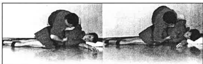
Manœuvre effectuée sur une personne allongée.