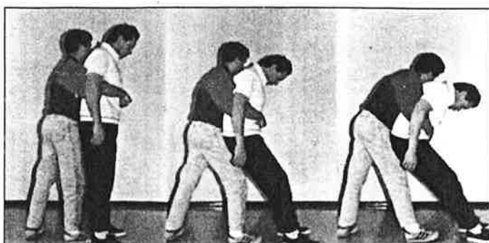
Manœuvre effectuée sur une personne debout